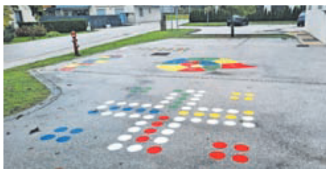
Talni gibalni poligon za otroke so v Mošnjah izdelali učitelji skupaj s starši in učenci.

Doslej so tako v Radovljici na območju Cankarjeve in Gradnikove ulice že zasadili več kot petdeset novih dreves, poslikani in z mozaikom polepšani je podhod pod železniško progo ob Poljski poti. V Lescach pa so na otroškem igrišču zamenjali ograjo in uvedli video nadzor. Na smučarskotekaških progah v Kamni Gorici so obnovili lesena mostova in ograje, namestili lesena stojala za smuči in uredili hudournik, kupili so tudi opremo za vzdrževanje prog ter opozorilno in označevalno opremo. Dvorna Kulturnega