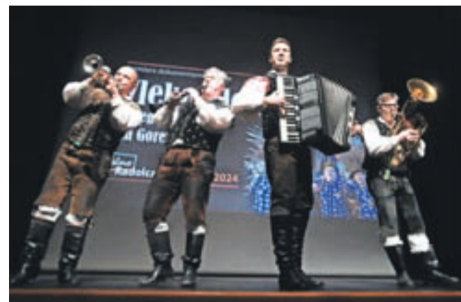
Vleka ploha v Begunjah seveda ni brez Divjih prašičev.