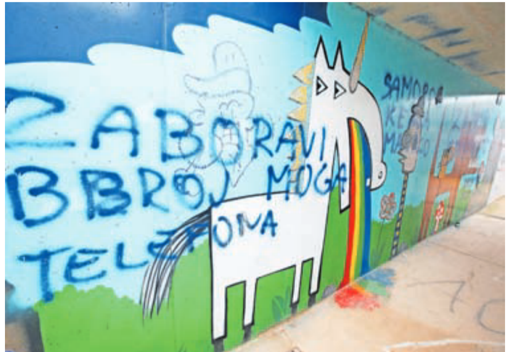
Eden od že izvedenih projektov je tudi poslikava podhoda pod železniško progo med Radovljico in Lescami. Žal so se novih poslikav in mozaikov že (spet) lotili vandali.