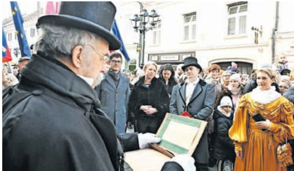
Častna pokroviteljica 21. Prešernovega smenja, predsednica državnega zbora Urška Klakočar Zupančič, je včeraj v Kranju prisluhnila tudi oznanilu mestnega glasnika.