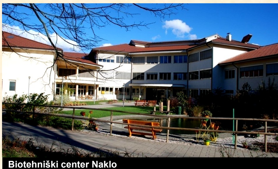
Biotehniški center Naklo

Biti želimo kvalitetna izobraževalna, raziskovalna in razvojna ustanova, ki postavlja v ospredje občutek za naravo, skrb za pridelavo in predelavo zdrave hrane ter skrb za urejenost okolja v sodelovanju z gospodarstvom. Spodbujati želimo podjetnost in inovativnost ter skrbeti za osebni razvoj in prijazno delovno okolje zaposlenih.