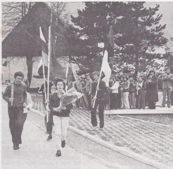
Iz Žirov je krenila lokalna štafeta mladosti

Dan OF in delavski praznik smo letos praznovali dokaj široko. V Žireh je bila osrednja občinska proslava, ki je bila še posebej posvečena misli in delu tovariša Edvarda Kardelja. Sledilo je še niz drugih prireditev.