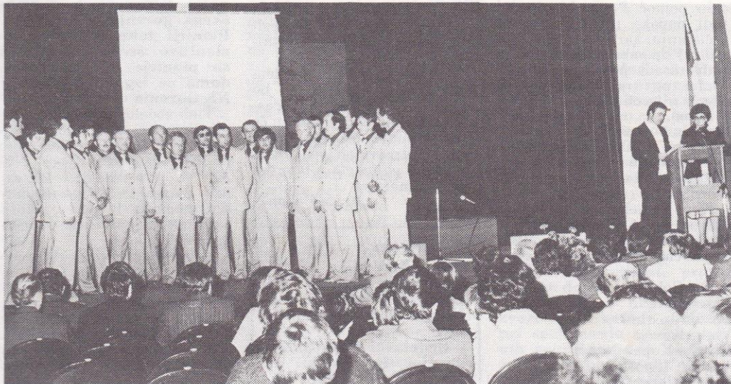
Letošnjo proslavo, ki je bila združena s podelitvijo srebrnih znakov zveze sindikata in priznanj OF, so obogatili tudi gostje, pevci iz Slovenskih Konjic

»DELO – ŽIVLJENJE« je glasilo ALPINE, tovarne obutve Žiri, Stara vas 23, n.sol.o., ki ima v svoji sestavi TOZD Obutev Žiri, TOZD Obutev Gorenja vas, TOZD Plastika ŽIRI, TOZD Prodaja Žiri in Delovno skupnost skupnih služb. Ureja ga uredniški odbor: Stane Čar, Anton Eniko, Srečko Erznožnik, Marija Kastelec, Tončka Oblak, Marta Pivk, Anuška Kavčič – tehnični urednik, Nejko Podobnik – odgovorni urednik. Izhaja mesečno, naklada 1800 izvodov. Tisk KT Gorenjski tisk, Kranj