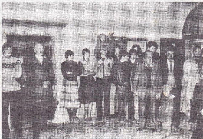
Planinci – fotografi so praznovanje popestrili z razstavo svojih del