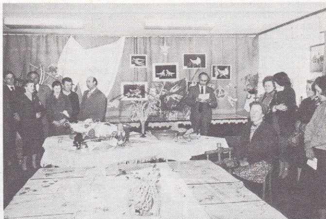
Izkazale so se tudi kmečke žene. Organizirale so razstavo ročnih del, ki je bila zelo dobro obiskana