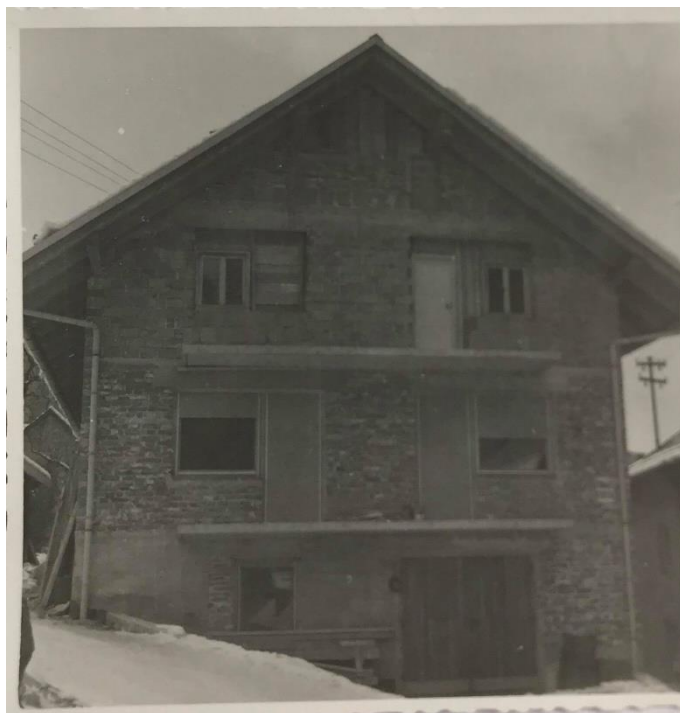
Slika 19: Hiša med gradnjo

Da, še vedno se rad posladkam s Kraš Ki – Ki bonboni, vseeno pa smo rajši imeli domačo hrano. Žena je pekla kruh in piškote sama, mleko je bilo doma, ravno tako tudi meso.«