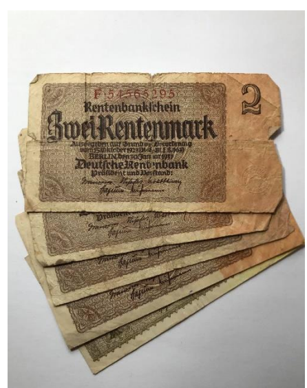
Slika 9: Okupacijski boni nemškega ozemlja