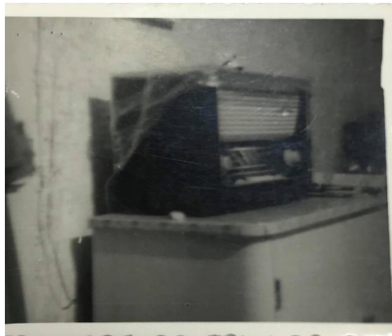
Slika 22: Radio, za katerega sta ata & mama varčevala eno leto

Zdi se mi, da je socializem gradil nas, saj nam je ukazoval, kaj in kako bomo delali.«