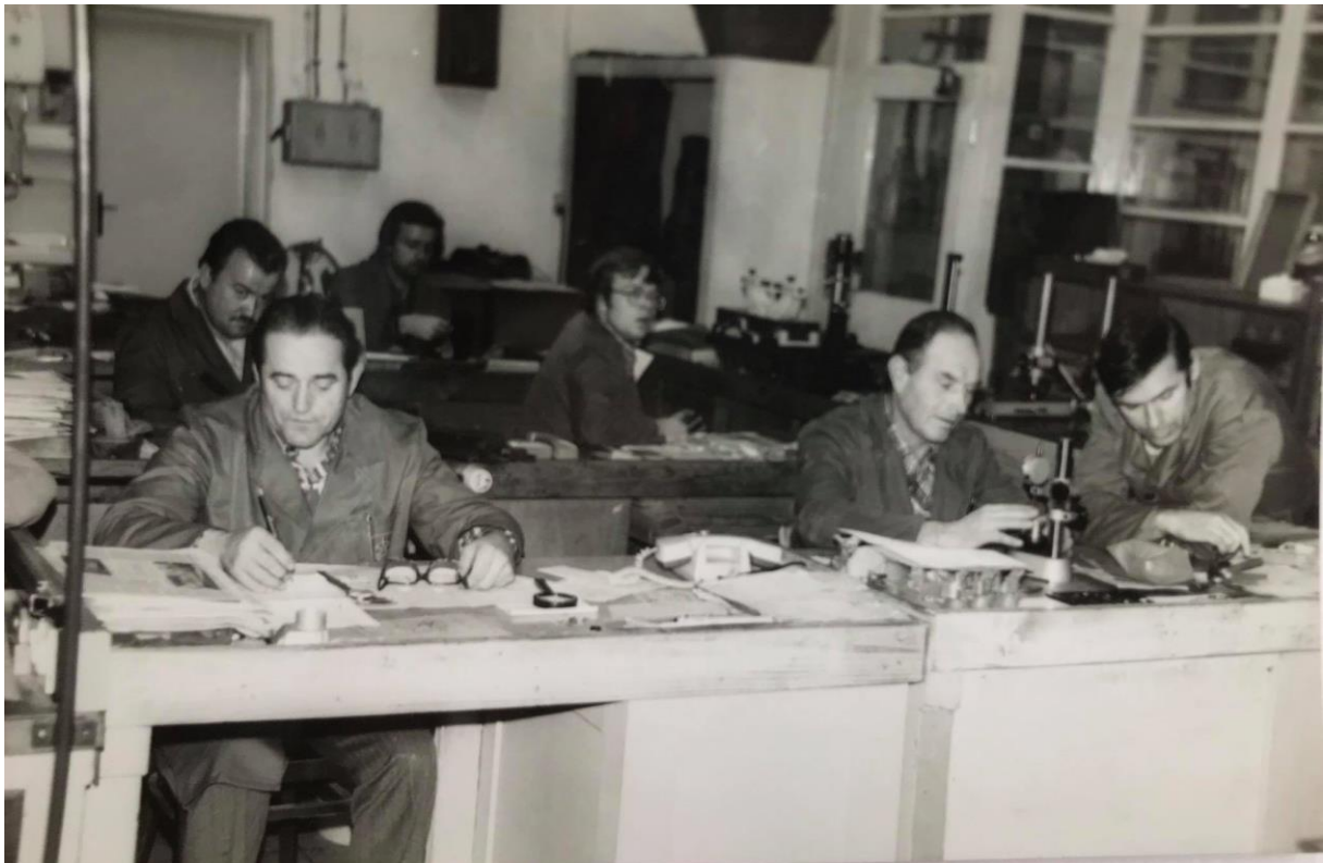
Slika 14: Oddelek funkcijske kontrole v orodjarni Iskre v Kranju

Gospodarska učinkovitost socializma je bila nihovita. Danes se mi gospodarska učinkovitost zdi dobra. Včasih pa smo kupovali v tujini, ker doma želenega izdelka nismo dobili ali pa je bilo predrago.«