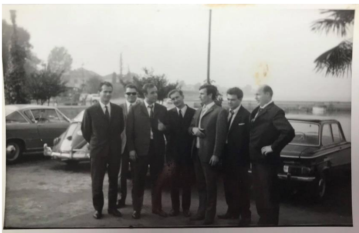
Slika 15: Ob obali Nice