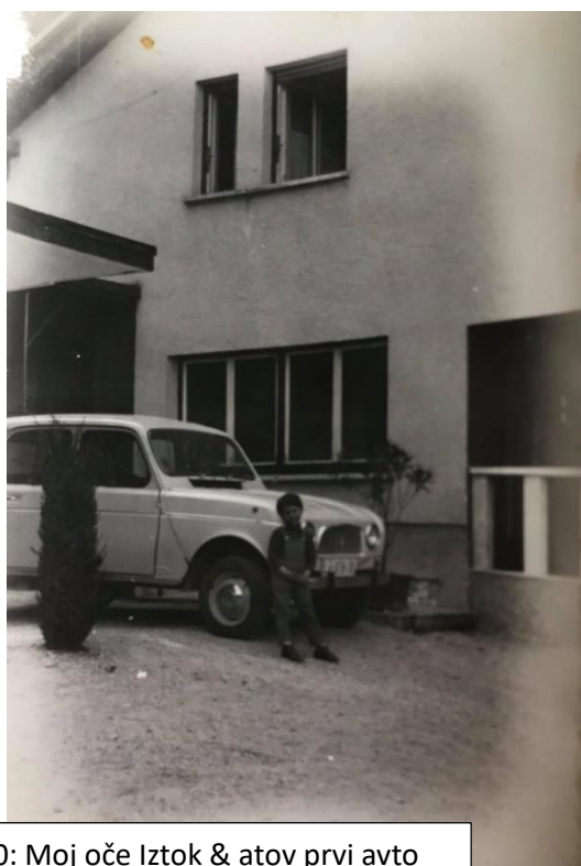
Slika 20: Moj oče Iztok & atov prvi avto katrca