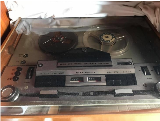
Slika 11 Magnetofon

»Na misel mi najprej pridejo Slaki, Avseniki, Don Juan in drugi. Imel sem tudi gramofon in magnetofon, ter pesmi sem snemal na trakove.«