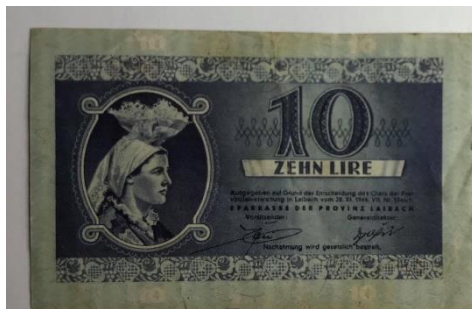
Slika 6: Okupacijski denar italijanske vojske.