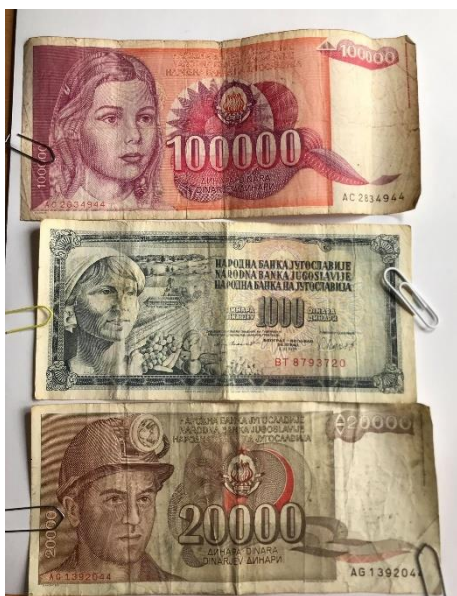
Slika 8: Jugoslovanski denar skozi desetletja.