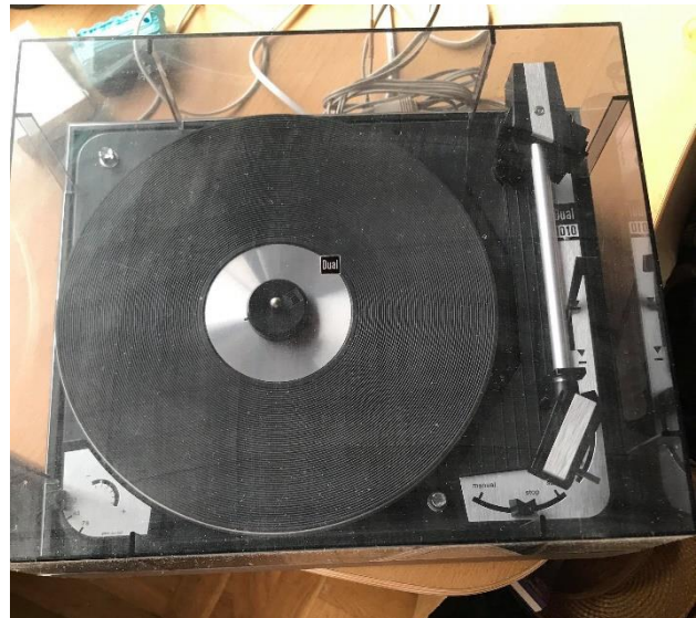
Slika 12: Gramofon