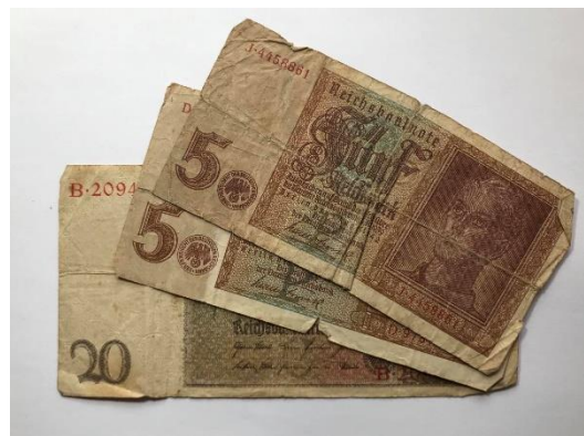
Slika 7: Okupacijski denar nemške vojske