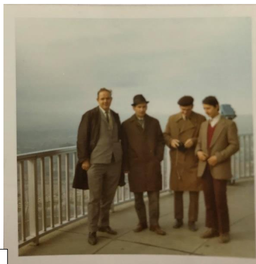
Slika 16: V Frankfurtu