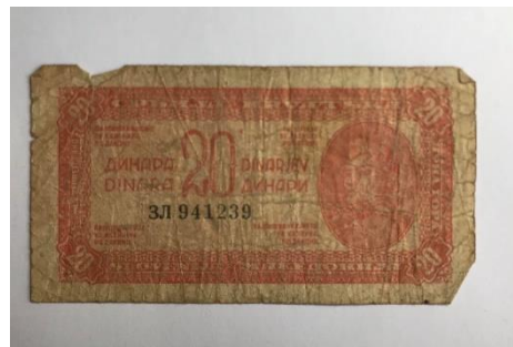
Slika 5: Bankovec prve Jugoslovanske republike, osvobojenega ozemlja