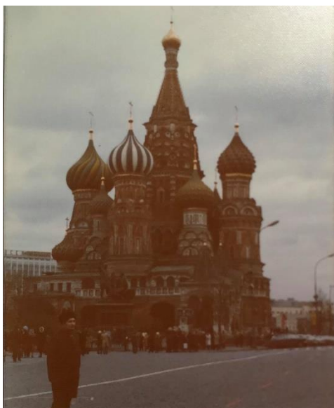
Slika 17: Sindikalni izlet v Moskvo