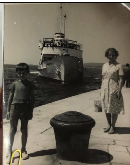
Slika 18: Dopustovanje na Pagu