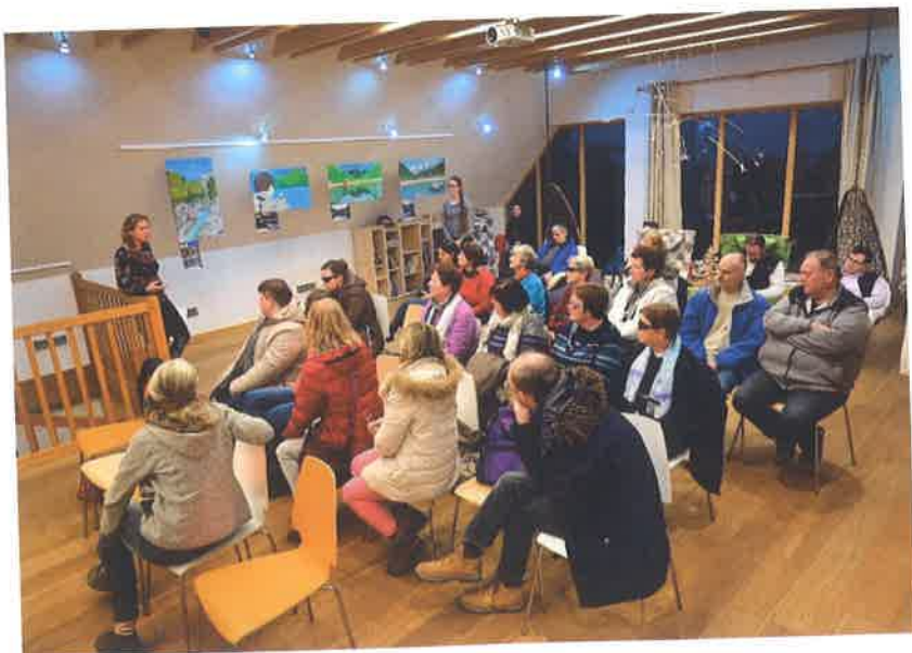
Ob otvoritvi razstave v centru Bohinjka v Stari Fužini

Razstava bo gostovala tudi v Centru IRIS, ki nam je pomagal narediti opise v brajici. Načrtujemo, da bomo razstavo lahko ponudili partnerskim šolam v projektu Your Alps, drugim zvezam in društvom slepih in slabovidnih po Sloveniji in seveda tudi preostali zainteresirani javnosti.