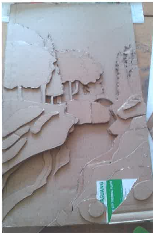
Večplastna slika v delu

Ena od nalog v projektu je bila izvedba fotografske delavnice. Na šoli imamo dvakrat na leto projektne dneve, kjer v dveh dneh dijaki in mentorji (zaposleni učitelji in zunanji sodelavci)