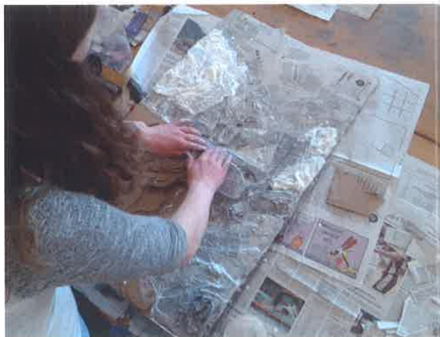
Kaširanje s časopisnim papirjem