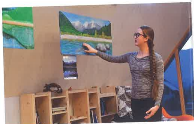
Dijakinja, avtorica slike, razlaga, kako je ustvarjala sliko.

svoje redno delo aktivno vključuje tudi ranljivo populacijo, tudi slepe in slabovidne. Cel dan so preživeli v Bohinju, ob spoznavanju naravnih vrednot in okolja. Otvoritev razstave je bila zanje presenečenje in velika nadgradnja obiska. Tudi sami se ukvarjajo s slikanjem, predvsem z akrilnimi barvami s peskom. Za slepe je reliefna slika vedno zelo dobrodošla, saj le na ta način lahko nekoliko začutijo dimenzijo globine prostora.