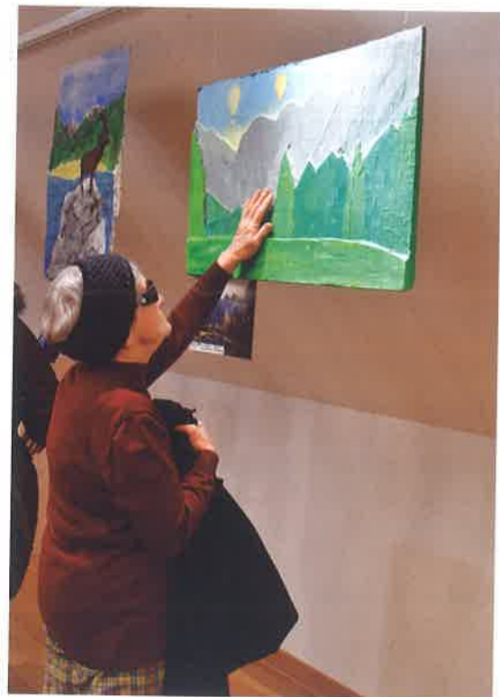
Starejša gospa ob ogledu slike