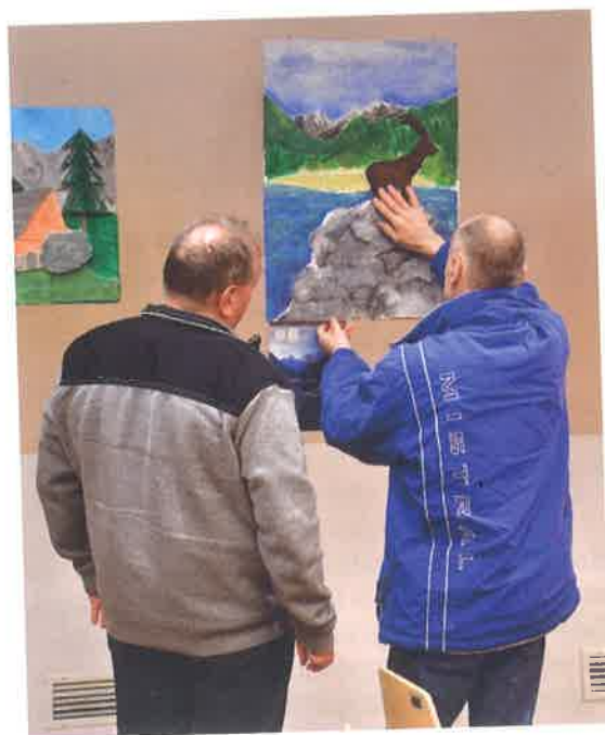
Obiskovalci so občudovali kozoroga.

Razstava bo gostovala tudi v Centru IRIS, ki nam je pomagal narediti opise v brajici. Načrtujemo, da bomo razstavo lahko ponudili partnerskim šolam v projektu Your Alps, drugim zvezam in društvom slepih in slabovidnih po Sloveniji in seveda tudi preostali zainteresirani javnosti.