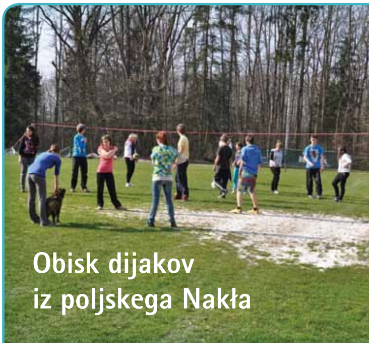
Obisk dijakov iz poljskega Nakła

Če bi tudi ti rad postal voditelj šolskega radia, nam piši na elektronski naslov biosfera.radio@gmail.com ali pa nas obiži v radijskem prostoru (soba za dežurnimi učenci) vsak dan od 6:45 do 7:25.