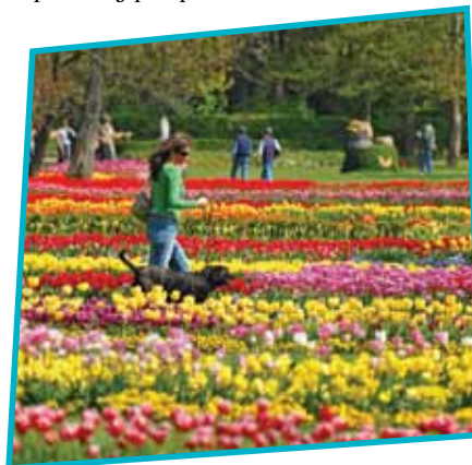
Amelia Stanonik, 2. L

Če ti je bolj pri srcu narava, bi bil zate sprehod po parku med najrazličnejšimi avtohtonimi in tujimi vrstami dreves, rož, grmovnic od Evrope, Amerike do Azije ... Tam si lahko ogledaš tudi razstave metuljev, kaktusov ali orhidej. Med poletnimi počitnicami se v Arboretumu dogaja marsikaj, npr. delavnice za otroke in odrasle, razna strokovna predavanja in vodenja po parku. Za podrobnejše informacije pobrskaj po spletu.