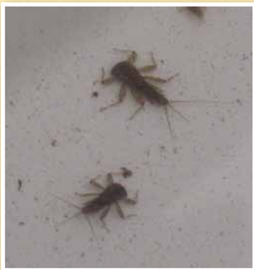
Prisotne živali v gorskem potočku so dokaz, da je voda čista