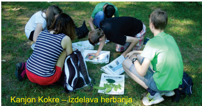
Kanjon Kokre – izdelava herbarija