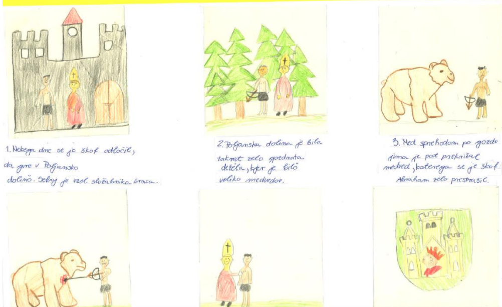
Strip o škofu Abrahamu – dijakinja 1. M

Dijaki in dijakinja 1. M in 1. L razreda smo imeli naslednji dan, 25. 10. 2018, ustvarjalne delavnice na temo Škofje Loke in vsega, kar smo spoznali prejšnji dan. Nekaj skupin je ustvarjalo stripe (o škofu Abrahamu in nastanku loškega grba, o škofu Leopoldu), nekateri so izoblikovali lutke (za Škofjeloški pasijon, igro o Hudičevi brvi, igro o Kamnitem mostu), ena izmed skupin je naredila zanimivo družabno igro Po Romualdovi poti , dve skupini pa sta se lotili pisanja časopisa oziroma zapisa o našem spoznavanju kulturne dediščine bližnjega mesta.