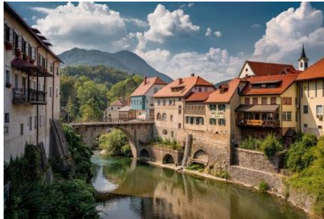
Pogled na Kamniti most

Cerkev je s podzemnim rovom povezana s Škofjeloškim gradom; zgrajena je bila v 14. stoletju. Na fasadi ima relief križanja.