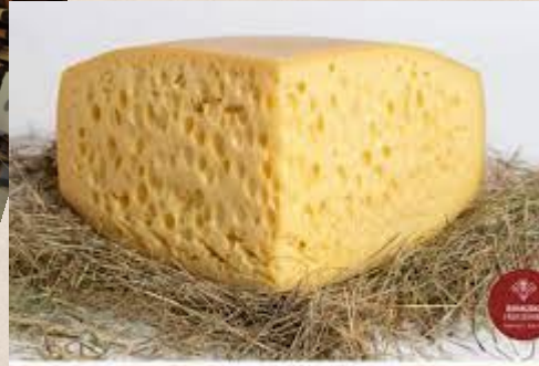
TURISTIČNA KMETIJA GARTNER PR' ODOLNEKU, STUDOR V BOHINJU