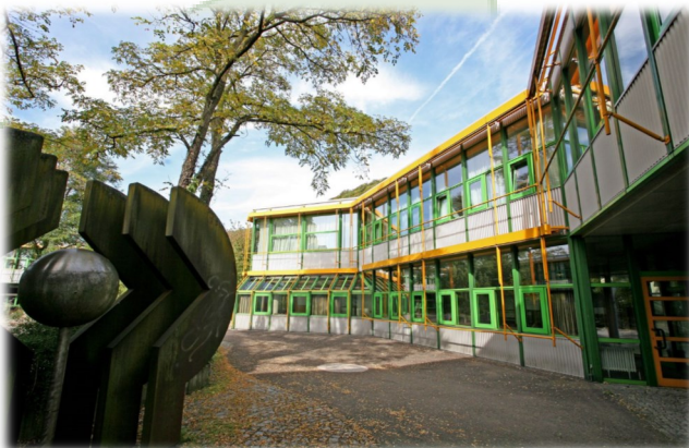
Šola Kaufmännische Schule Geislingen

KSG je nemška šola v bližini Ulma, ki izvaja šest različnih programov na področju podjetništva in administracije in se odlično povezuje s trgovsko zbornico, lokalno univerzo ter z več podjetji, pri katerih dijaki opravljajo prakso na različnih oddelkih. Šola želi izboljšati pripravljenost dijakov za delo v drugih državah EU. Prav tako želi razvijati pri dijakih kompetence, ki bodo omogočale njihovo samozaposlitev.