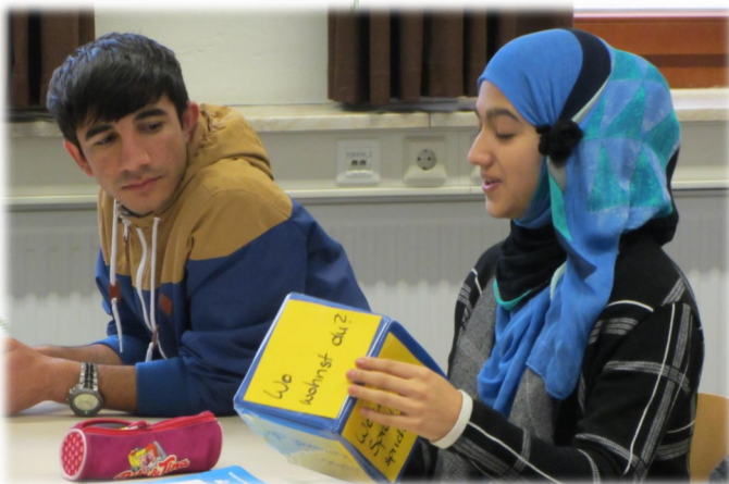
Pouk nemščine za begunske srednješolce

Begunci niso integrirani v redni šolski sistem, jim pa občasno pripravijo skupne delavnice z nemškimi dijaki. Nekaj ur teh delavnic so obiskale tudi učiteljice našega centra, ta izkušnja pa je bila po njihovih besedah zelo močna.