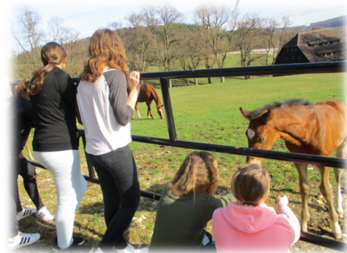
Ogled kobilarne Marbach