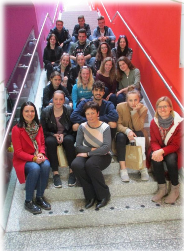
Udeleženci mobilnosti v šoli

V okviru programa so dijakinje pridobile podjetnostjo kompetenco, izboljšale so znanje nemškega jezika in razvijale medkulturno kompetenco. Aktivnosti so bile organizirane v obliki pouka na šoli v oddelkih ekonomske gimnazije in ekonomskega tehnika (učne ure, praktično delo v simulacijskem podjetju) in z delom na terenu: strokovni ogled tovarne WMF v Geislingenu, kulturni in zgodovinski ogledi v mestih Geislingen in Ulm - razstava umetnika Billa Wilkinsa; ogledi največje katedrale na svetu, zgodovinskega mesta Esslingen am Neckar, deželnega muzej in mestne knjižnice v Stuttgartu. Na ogledu kobilarne Marbach so preko razgovora z vodičem spoznali zgodovino kobilarne in razpravljali o razvojnih in turističnih možnostih kobilarne. Pobljize so spoznali marketinški pristope, načine sodelovanja z lokalno skupnostjo ter se urili v nemškem jeziku.