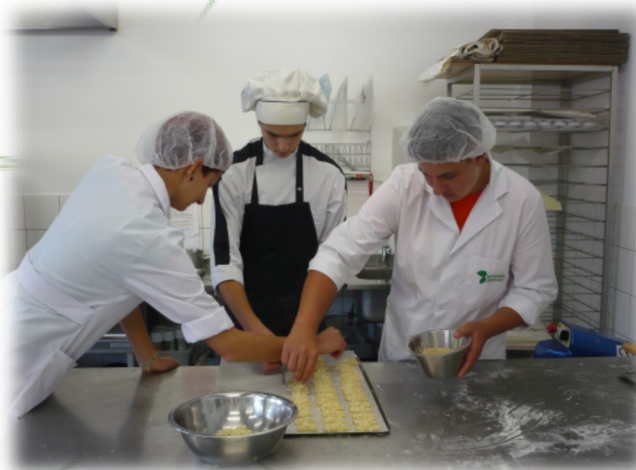
Med delom v kuhinji

V Estoniji se pekarstvo in slaščičarstvo poučuje v skupnem srednješolskem izobraževalnem programu. V sklopu tega programa na šoli opravljajo prakso, končne izdelke pa prodajajo v šolski menzi. Dijaki kuharstva med prakso pripravljajo malico za vse dijake na šoli, pri tem pa jim pomagajo njihovi učitelji.