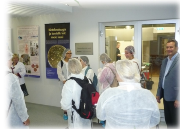
Obisk šole v okrožju Viljandi

Šola gostiteljica je organizirala ogled bližnjega naravnega parka Tolkuse bog, kjer so občudovali naravne lepote države, z ogledom dveh poklicnih šol, Viljandi Joint Vocational Secondary School in Olustvere School of Service and Rural Economics, pa so se podrobneje seznanili z estonskim modelom izobraževanja.