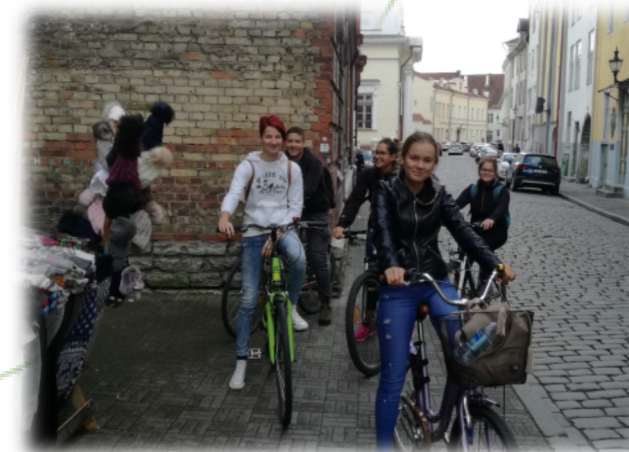
Ogled Talina na kolesih

Ob koncu tedna so spoznavali geografske znamenitosti Estonije – z ogledom Talina in Tartuja so поблиže spoznali kulturne znamenitosti mest in utrip turističnih središč.