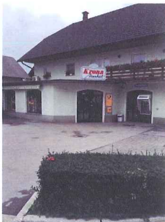
Slika 3: Krona market Brezje