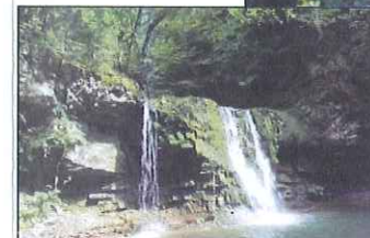
Slika 6: Slap na poti miru