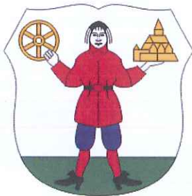
Slika 6: Grb občine ( https://sl.wikipedia.org/wiki/Ob%C4%8Dina_Radovljica )