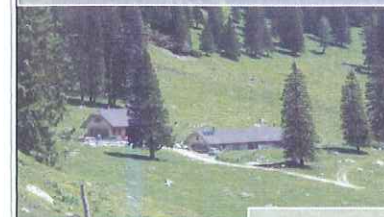
Slika 5: Pot miru Brezje