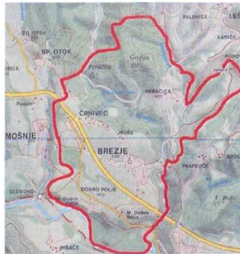
Slika 7: Zemljevid Brezij ( http://pisarna.brezje.si/default.aspx )

Brezje se nahajajo tik ob avtocesti Ljubljana-Jesenice.