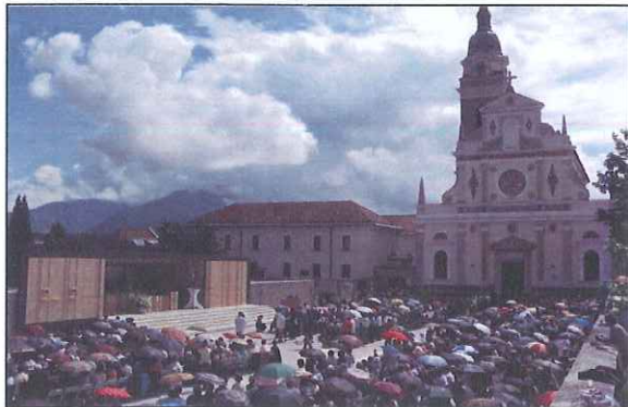
Slika 2: Romanje bolnih ter invalidov na Brezjah ( http://zupnija-gomilsko.rkc.si/?p=436 )

Domačini so se od nekdaj preživljali s kmetovanjem in konjerejo.