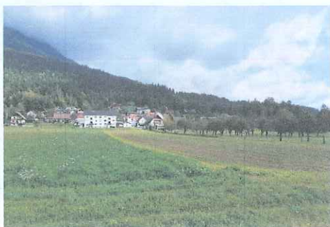
Slika 2: Pogled na Kriško polje

Križe se v starih listinah prvič omenjajo okoli leta 1400. Ob prvem štetju prebivalcev izvedenem leta 1754 so v kraju našli 77 hiš in 514 prebivalcev. Toliko prebivalcev je kraj dosegel šele po končani drugi svetovni vojni. Med obema vojnoma se je večina prebivalstva preživljala s čevljarsko obrtjo, preostali pa so bili kmetje in delavci, zaposleni v tržiških tovarnah. Križe so bile nekaj časa tudi samostojna občina.