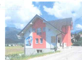
Slika 6: Gasilski dom

Društvo je bilo ustanovljeno leta 1924 in je skozi svojo 86 letno zgodovino doživljalo tako vzpone, kot padce. Gasilski dom so začeli prenavljati v letu 2008. Njihova vizija je združevanje ljudi. Dobre volje, ki s svojim prostovoljnim delom združuje in pomaga ljudem v stiski.