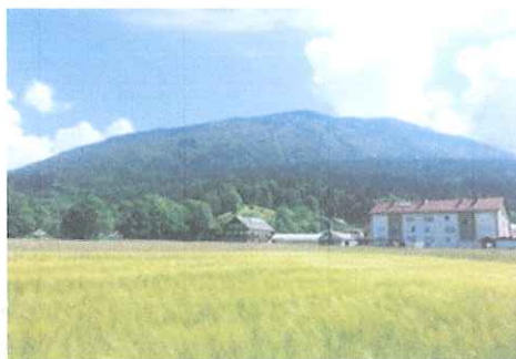
Slika 4: Kriško polje

se razteza od Križev pa vse do Pristave. Ime je dobilo po vasi Križe. Je zelo dobra sprehajalna pot.