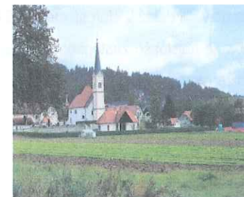
Slika 5: Župnija

Župnijski dom sestavlja: Župnijski dom v Križah, Cerkev sv. Križa v Križah, Mrliška vežica, Kapelica Brezmadežne. Cerkev so prvič že omenili v letu 1421. Leta 1417 so Turki požgali kipe in jo spremenili v hlev. Obnovljen je bila 10 junija 1494.