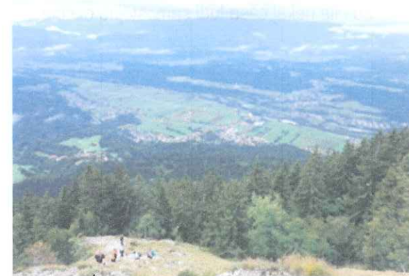
Slika 1: Pogled na vas iz Kriške gore

Del Kamniško-Savinskih Alp je tudi Kriška gora. Na Kriško goro se lahko povzpnete iz Križev. Za pot boste potrebovali dobre 3 ure hoje. Pot vas bo vodila do naselja Veterno pot lahko nadaljujete po gozdu ali gozdni cesti do Gozd. V Gozdu vas čaka prijetna postojanka. Pot nadaljujete do Kriške gore. Po dobrih 3 urah hoje ste prispeli na vrh, kjer je planinska koča, z prijaznim skrbnikom in dobro postrežbo v kolikor vam je vreme naklonjeno ste lahko deležni prečudovitega pogleda.