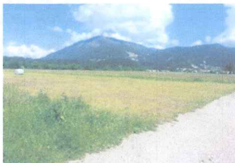
Slika 3: Kriška gora

je dobrih 5 kilometrov dolg greben, ki se razprostira vzhodno od Tržiča zahodno od Storžiča. Ime je gora dobila po vasi Križe, ki leži tik ob njenem vznožju. Na 1471 m stoji Koča na Kriški gori.