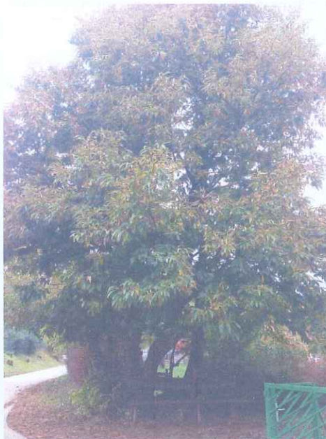
Slika 3: Kostanj

Vaški kostanj: Kostanj je star okoli 70 let. Pod kostanjem je klopca, kjer se zbirajo vaščani in si izmenjujejo aktualne novice.