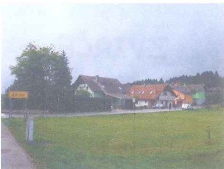
Slika 2: Vas Zvirče

Zvirče ležijo na nadmorski višini 491m. Ležijo južno od Kovorja, nad desnim bregom Tržiške Bistrice. Na južni in zahodni strani so prostrani iglasti gozdovi. Med letoma 1961 in 1991 se je število prebivalcev več kot podvojilo, saj so zgradili številne nove hiše. V naselju je nekaj manjših obrtnikov, ohranile so se še štiri kmetije, sicer pa so Zvirče tipično splano naselje. Spada v občino Tržič.