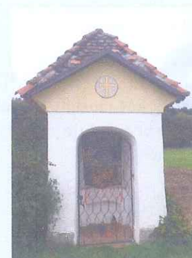
Slika 5: Kapelica

Znamenje ob cesti Zvirče - Podtabor: na zvirškem polju je stara, vendar lepo ohranjena kapelica, iz pred druge svetovne vojne.