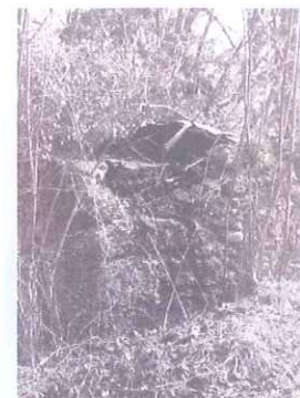
Slika 4: Pašba

Pašba: Ko je v Zvirčah pred 400 leti primanjkovalo hrane, so zgradili 2 pašbi, sušilnici za sadje. med vojno, so pašbi preuredili v skromno bivališče. Kamniti ostanki so vidni še danes.