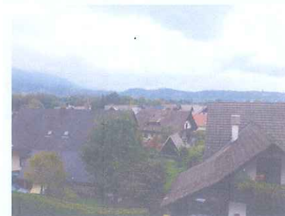
Slika 1: Zvirče