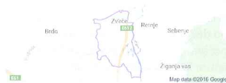
Slika 6: Zemljevid Zvirče

V Zvirčah je 392 prebivalcev (2015). Več je žensk kot moških. Pri mladem prebivalstvu prevladujejo moški, starejše so ženske.