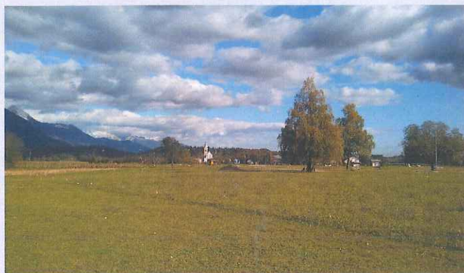
Pogled iz Črničva na Brezje

Brezje ležijo na nadmorski višini 485 m, z lepim pogledom na Triglav, Karavanke s Stolom in Begunjsčico. Znane so po baziliki Marije Pomagaj, ki je glavno slovensko Marijino svetišče, torej kraj miru, ljubezni in upanja. Brezje so bile v pisnih virih prvič omenjene že v 11. stoletju, nastanek imena pa ima več razlag. Po eni od teh ime izhaja iz številnih brez, ki naj bi rasle na tem območju. Domačini še danes raje uporabljajo besedo breški (breško polje, breška Marija), medtem ko je uradno v uporabi beseda brezjanski (brezjansko polje, brezjanska Marija). Domačini so se že nekdanj preživljali s kmetovanjem in konjerejo, dodaten vir zaslužka pa je bilo kamnoseštvo, ki je temeljilo na zelenem peračiškem tufu. Znane so tudi kot romarski kraj slovenskih kristjanov, ter so obiskane so čez vse leto (300.000 obiskovalcev letno), glavni romarski shod pa je na praznik Marije Pomagaj 24. maja.