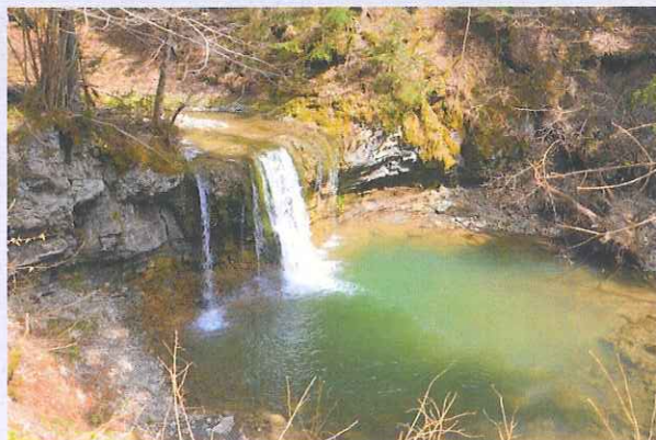
Slap Peračica, vir: goo.gl/eq30iB

Peračiški slap je prosto padajoči slap: voda na celotni dolžini padca nikjer ne pride v stik s steno. Visok je 4m, zliva pa se v širok in velik tolmun. Do slapa vodi pot miru.