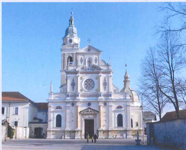
Bazilika Sv. Vida, vir: goo.gl/R0eH9r

V baziliki sv. Vida danes častijo milostno podobo Matere Božje, ki jo je naslikal Leopold Layer leta 1814. Novorenesančna stavba vzbuja vtis mogočnosti. Visoka je kar 17 metrov in dolga 39 metrov. Nad podbojem glavnih vrat je marmornati relief Marije Pomagaj. Nad belim glavnim oltarjem je mozaična slika sv. Vida, ki je ostal patron cerkve.