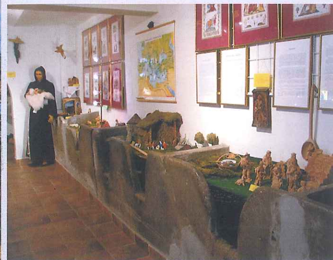
Muzej Sončna pesem, vir: http://kandela.si/wp-content/

Muzej Sončna pesem je dobil ime po naslovu hvalnice stvarstva, ki jo je napisal sv. Frančišek. Muzej ima dve temeljni zbirki, ki se med seboj dopolnjujeta. Prva z ohranjenimi votivnimi predmeti priča o bogati romarski dediščini Brezij, druga pa o tradiciji.