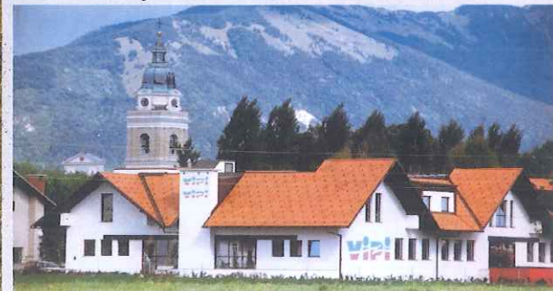
Tovarna Vipi

Klanšek je malo družinsko podjetje z 48-letno tradicijo proizvodnje brezalkoholnih pijač Vipi , ki jo dopolnjujejo še kisi in žganja. Posebej velja omeniti jabolčni sok, izdelan iz sveže mletih in stisnjenih slovenskih jabolk.