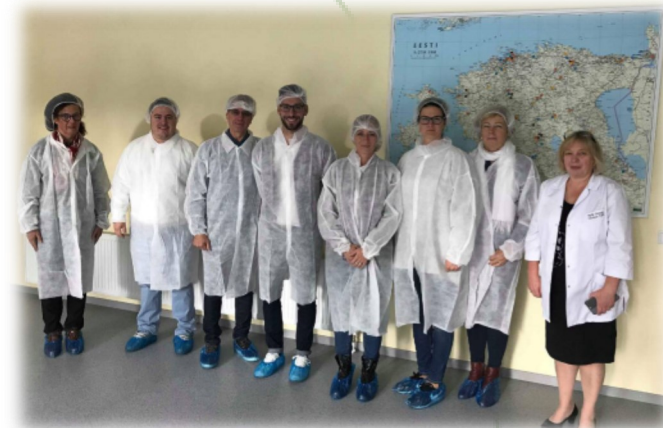
Obisk šole v okrožju Viljandi

Pärnumaa Kutsehariduskeskus se nahaja v mestu Pärnu in sodi med večje estonske šole, obiskuje jo okoli 1300 dijakov različnih poklicnih programov: slaščičarsko-pekarske, kuharske, kozmetične, trgovske, mehanične, bolničarske, šiviljske, frizerske usmeritve.