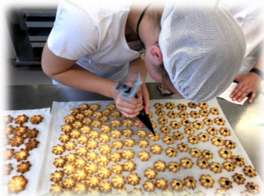
Udeleženci mobilnosti v šoli