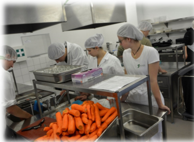
Med delom v kuhinji

V Estoniji se pekarstvo in slaščičarstvo poučuje v skupnem srednješolskem izobraževalnem programu. V sklopu tega programa na šoli opravljajo prakso, končne izdelke pa prodajajo v šolski menzi. Dijaki med prakso pripravljajo malico za vse dijake na šoli, pri tem pa jim pomagajo njihovi učitelji.