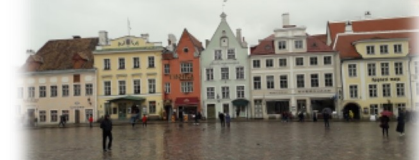
Ogled Talina in Tartuja