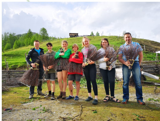
Izdelovanje metel na tradicionalni način

Med praktičnim delom so imeli nekaj časa tudi za spoznavanje kulture, narave in tradicije parka. Obiskali so muzej glasbil Gmünd, kjer so nekaj nenavadnih glasbil tudi preizkusili, odšli so do jeza v Maltatalu in si ogledali čudovit slap. Izdelovali so tradicionalne lesene metle iz brezovega lesa. Priznani čebelar jim je predstavil delo s čebelami in domače medene izdelke. Adrenalin so si dvignili z obiskom pustolovskega parka.