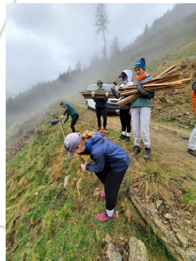
Pomoč pri pogozdovanju

Pri lokalnem kmetu so izdelovali tradicionalne lesene metle iz brezovih vej. Obiskali so tudi čebelarja, ki je z veseljem predstavil svoje delo.