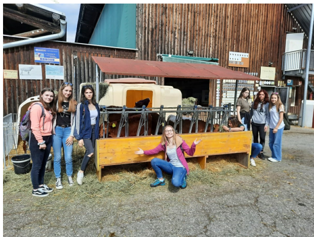
Udeleženci mobilnosti na kmetijski šoli Litzlhof

Sedem marljivih dijakinj ter dva profesorja so se v času od 4. 5. 2022 do 13. 5. 2022 udeležili mednarodne mobilnosti v Biosfernem parku Nockberge v Avstriji. Mobilnosti so se udeležile dijakinje programov gimnazija ter naravovarstveni tehnik.