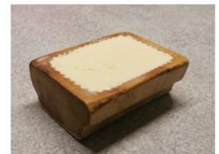
Slika 14: Doma narejeno maslo.