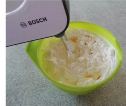
Slika 11: Smetano stepamo, dokler se ne strdi.