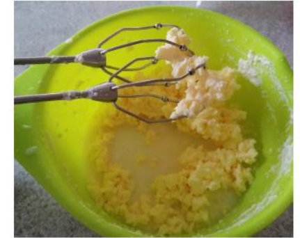
Slika 12: Nastajati bo začela tekočina, ki jo odcedimo.