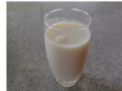
Slika 13: Pirjenec.