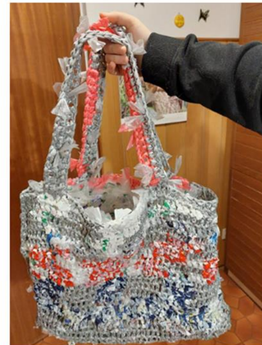
Slika 14: Recikrirana nakupovalna torba