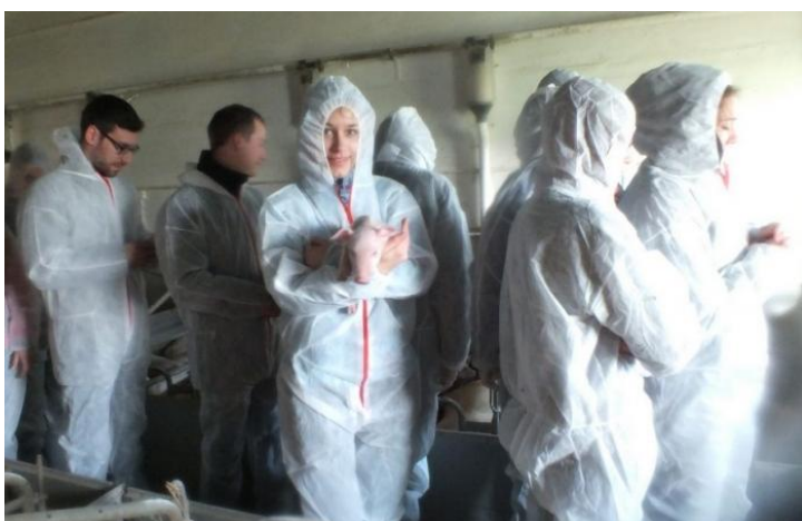
Slika 45: Kastracija prašičev