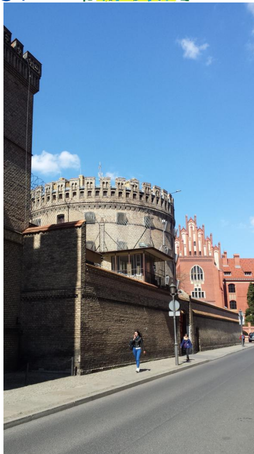
Slika 52: Prapor v Torunu