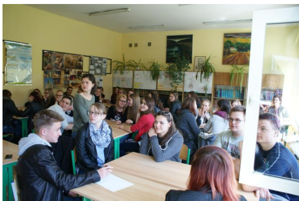
Slika 25: Ura angleščine