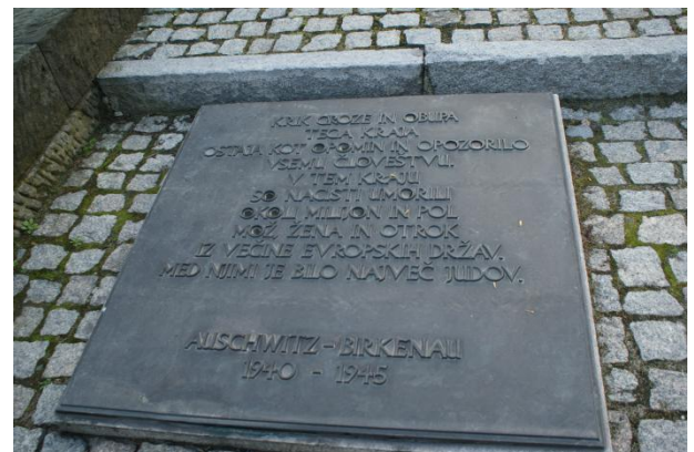
Slika 7: Spominska tabla v slovenskem jeziku