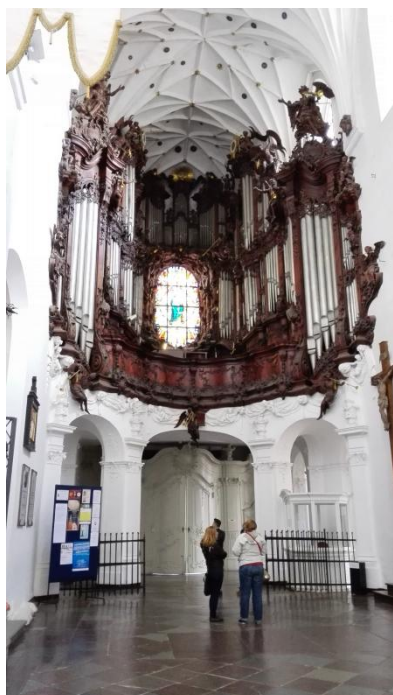
Slika 41: Ogromne orgle