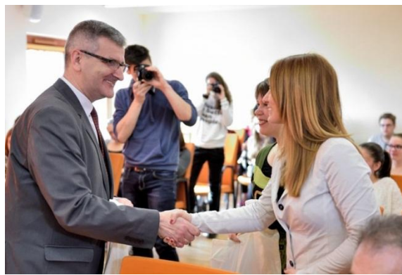
Slika 17: Spoznavanje