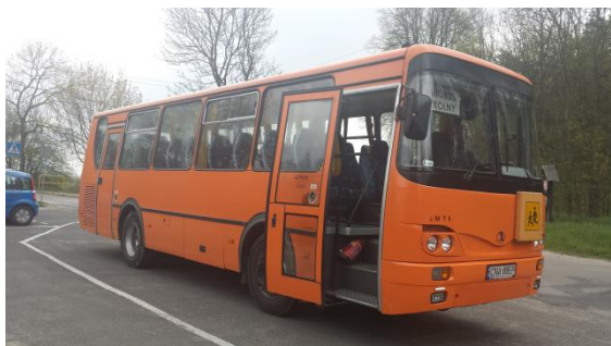
Slika 60: Poljski šolski avtobus