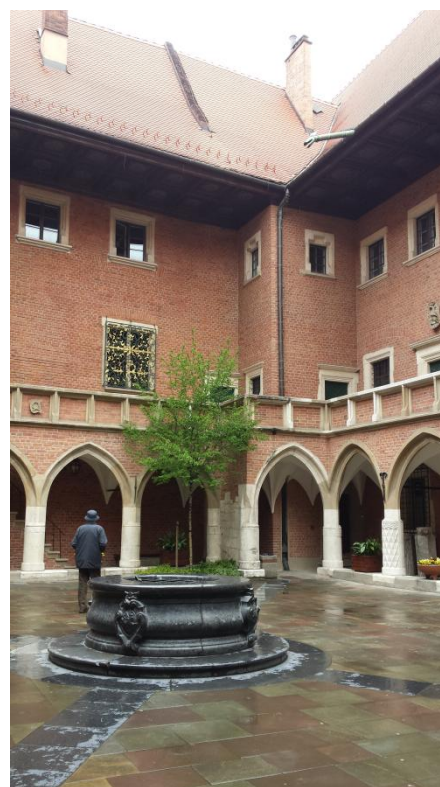
Slika 5: Najstarejša še stoječa univerza na svetu