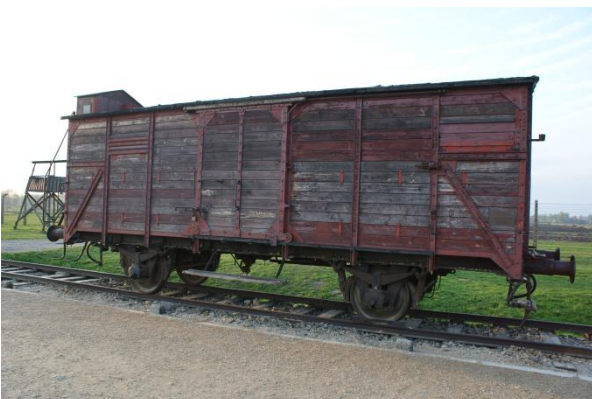
Slika 8: Vlak s katerim so pripeljali žrtve v taborišče