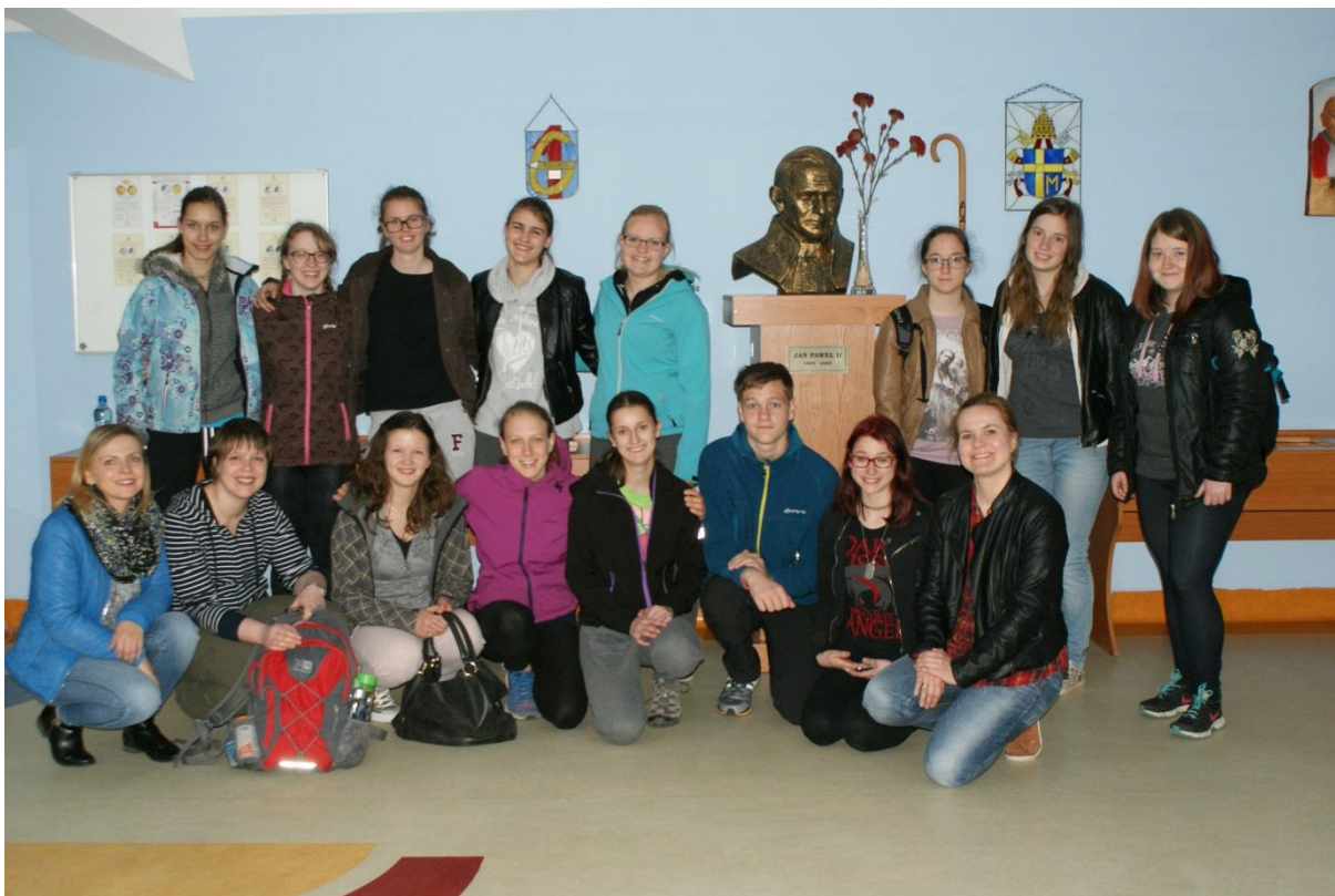
Slika 22: Soba posvećena papežu Janezu Pavlu II