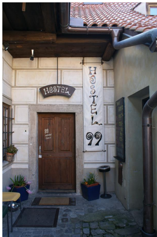
Slika 58: Hostel na Češkem