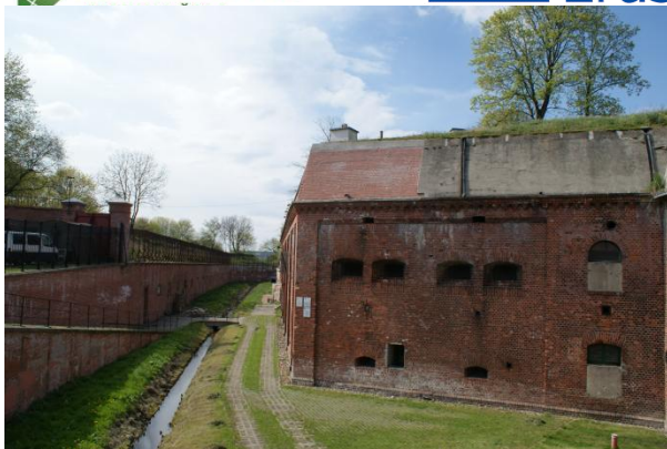
Slika 53: Trdnjava ki je včasih ščitila Torun