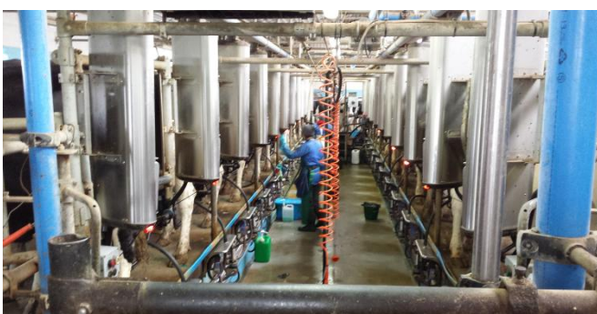
Slika 47: Molzni stroji