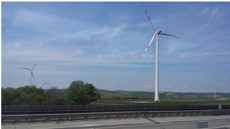
Slika 3: Ravnine in vetrnice v Nemčiji

Naša pot se je pričela v jutranjih urah, z zborom pred našo šolo. Prtljago smo nesli na avtobus in ob osmih krenili proti Poljski. Imeli smo nekaj kratkih postankov za hrano in stranišče. Na Dunaju sta se zamenjala voznika avtobusa. Med vožnjo smo opazovali pokrajino, ki je postajala vse bolj ravna. Peljali smo se čez Avstrijo in Slovaško. Ob dvajsetih smo prečkali Slovaško Poljsko mejo in čez dve uri prispeli v Krakow. Celotna pot je trajala tirinajst ur. V Hostlu Good Bye Lenin nas je počakala večerja, ki so nam jo dostavili iz restavracije. Vsi utrujeni smo se razdelili v sobe in odšli spat.