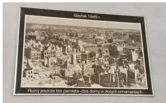
Slika 39: Porušeno mesto leta 1945