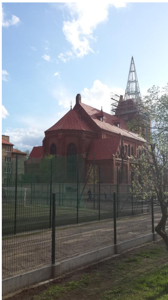
Slika 15: Cerkev svetega Stanislava v Naklem

Vstali smo ob petih, iz hotela smo odšli ob pol šestih. S seboj smo vzeli tudi pakete s hrano, ki so nam jih pripravili v restavraciji. Ob šesti smo se z avtobusom odpravili proti Naklu. Vožnja je trajala kar 8 ur, seveda pa smo si privoščili tudi postanke. Nastanili smo se v Art Caffé hotelu. Tu je bil prijeten ambijent in prijazno osebje. Razdelili pa smo se v sobe za tri in pet oseb. Z veseljem smo pojedli vso kosilo ki so nam ga pripravili. Dobili smo pečenega piščanca s sirom, pomfri in solato. Ob petih smo se zbrali pred hotelom in odšli na sprehod. Profesorica angleščine nam je razkazala mesto Naklo. Ogledali smo si nekaj cerkva, starih šol, kipov in tako dalje. Po triurnem spoznavanju mesta smo se ustavili v kavarni in si privoščili zaslužen pijačo. Ob osmih so nam pripravili večerjo. Nato smo dolgo v noč igrali Jungle speed. Sledil je tuš in kot muhe smo popadali v posteljo.