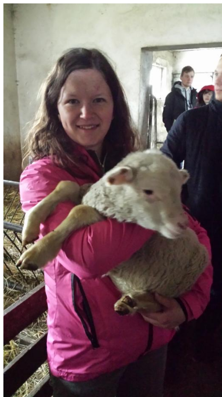
Slika 48: Ovčja farma