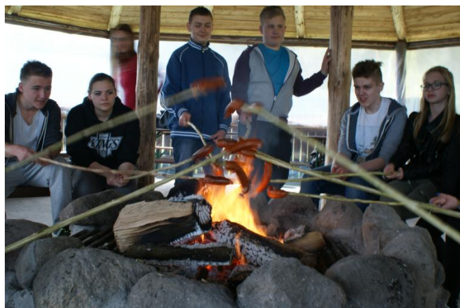
Slika 21: Peka hrenovk