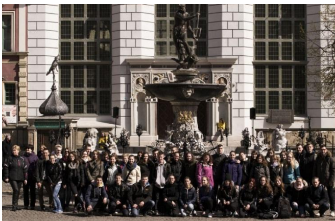
Slika 38: Dolga ulica z vodnjakom

Vstali smo ob šestih, zajtrk pa nas je čakal že od pol sedmih. Z avtobusom smo se peljali 200 km severneje v Gdansk. Z vodičem smo se dobili na Dolgi ulici, ki je najbolj poznana in priljubljena ulica v mestu. Na trgu stoji Neptunov vodnjak. Legenda pravi, da so ljudje vanj metali denar, to pa Neptunu ni bilo všeč. Zato je vodo spremenil v alkoholno zlato tekočino, ki ji danes pravijo zlata voda. Povsod po mestu so hodili ljudje v rumenih majicah z narcisami v roki. Zbirali smo denar za bolnico za umirajoče ljudi. Tudi mi smo darovali nekaj denarja in dobili narciso, kar je res lepa gesta. Obiskali smo tudi največjo cerkev iz opeke, sprejme lahko do 25000 ljudi. Najprej je bila katoliška, zdaj pa je protestantska. Povzpeli smo se na vrh cerkve, do tje je vodilo več kot 400 stopnic. Ampak razgled nas je očasal, videli smo celotno mesto, tja do morja. V pristanišču smo si ogledali kolesje, ki sta ga včasih poganjala dva človeka. Sestradani smo se odpravili proti restavraciji Swojski Smak, kjer so nam postregli z govejo juho, kromperjem in mrežno pečenko. Nato smo se odpeljali v katedralo poslušat kratek koncert ogromnih orgel. Zvok je bil res imeniten. Nazadnje smo se odpeljali v Sopot, kjer letujejo znani poljaki. Sprehodili smo se do Baltika. Pogled na morje me je očaral, kljub mrazu in vetru sem na obali izjemno uživala. A dan se je počasi iztekel in vrniti smo se morali v Naklo. V hotel smo prišli ob devetih zvečer.