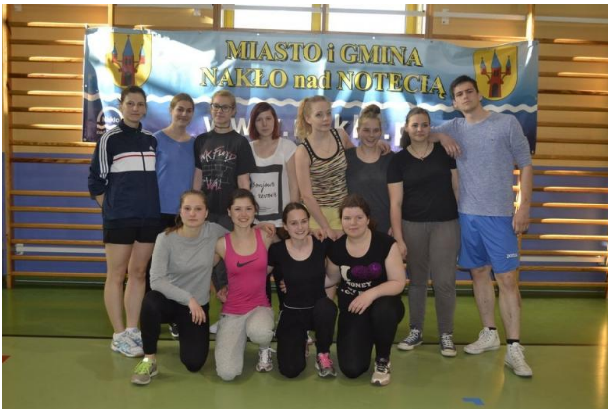
Slika 23: Po odigrani tekmi odbojke