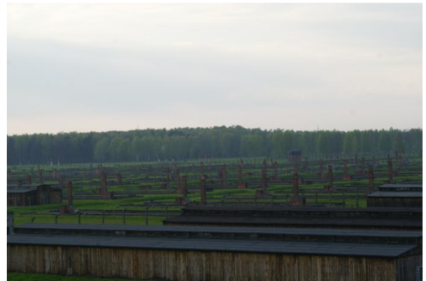
Slika 9: Pogled z razglednega stolpa