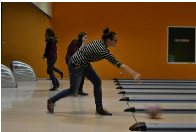
Slika 56: Bowling