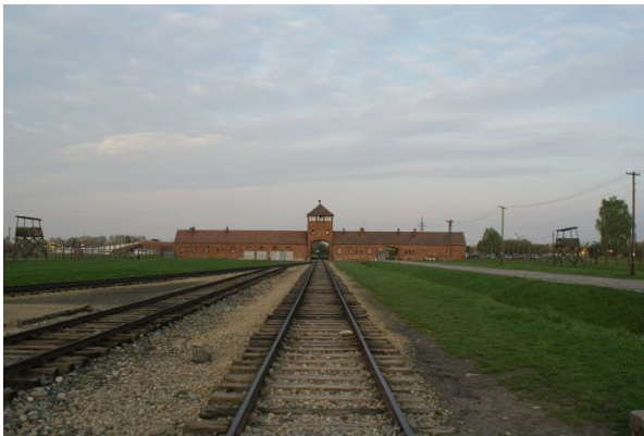
Slika 10: Vhod v Auschwitz II