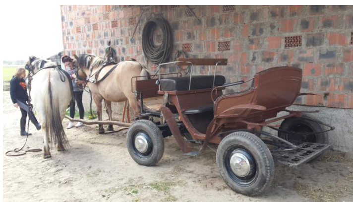
Slika 36: Priprava kočije