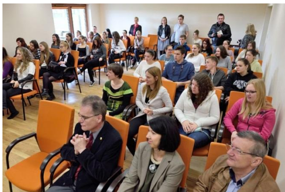
Slika 16: Med govorom