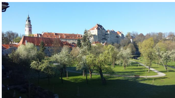
Slika 62: Razgled iz hostla

Zjutraj smo spakirali ter pojedli zajtrk, ki sta nam ga prinesla profesorja. Z vodičem smo se dobili na mestnem trgu. Povedal nam je kar nekaj legend o mestu v katerem živi. Odšli smo na razgledni stolp, kjer smo lahko videli vse mesto, ki smo ga že prej prehodili. Sledil je obisk labirinta. To je bil labirint z zrcali, zelo je bilo smešno, ker smo se zaletavali v zrcala in kot kure brez glave izkali izhod. Opazvali smo se tudi v različnih zrcalih. Nekatera so nas podaljšala, druga skrajšala, tretja popačila itd. Nato smo imeli nekaj prostega časa, da smo si lahko šli po nakupih ali na kavo. Imeli smo kosilo v restavraciji Don Julius v hoteu Zlatý Anděl. Hrana je bila res vrhnska. Najprej smo dobili juho, nato glavno jed in na koncu še sladico. Ambient je bil prekrasen. Ogljedali smo si še dvorec Roselberg, vodič nam je razložil, kako so živeli v tistih časih. Zanimivo se mi zdi kakšno razkošje so imeli višji sloji, kljub temu, kaj so preživljali nižji sloji. Po ogledu smo se ustaili pred hostlom, kjer smo vzeli kovčke in jih odnesli na avtobus. Našega bivanja na Češkem je bilo konec. Ob štirih smo odšli iz Krumlova, čez šest ur pa smo že prišli v Naklo.