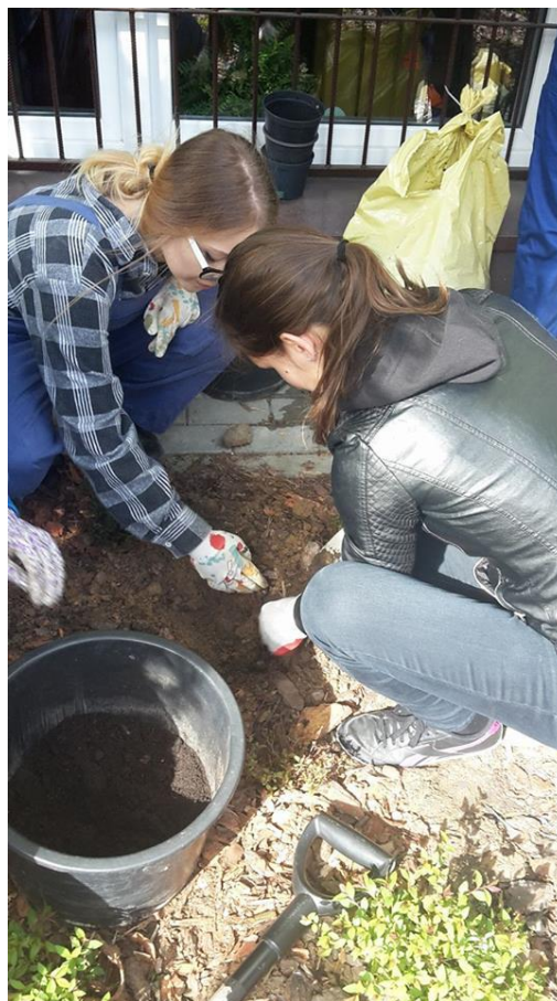
Slika 28: Sajenje rož na šolskem vrtu