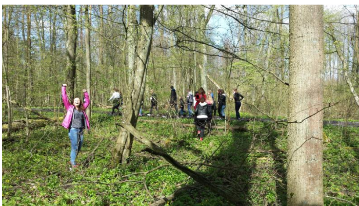
Slika 20: Dejavnosti v gozdu