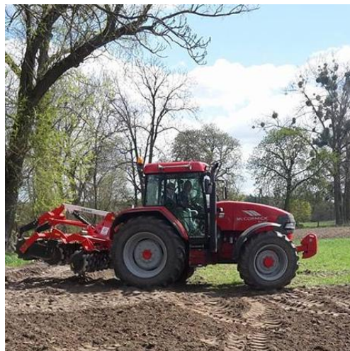
Slika 32: Vožnja v šolskem traktorju