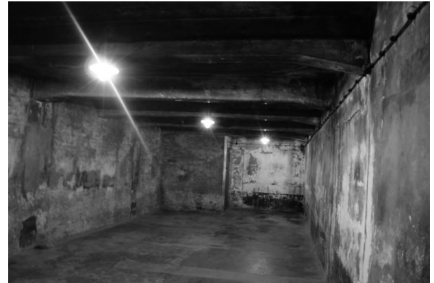
Slika 11: Plinsa komora