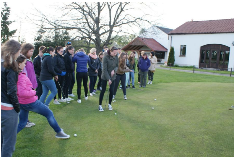
Slika 30: Začetni zamahi s palicami