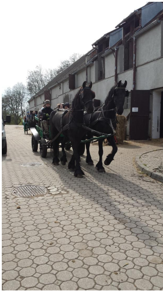
Slika 57: Vožnja s kočijo po posestvu