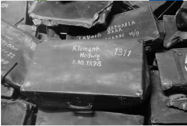
Slika 14: Kovčki usmrčenih judov