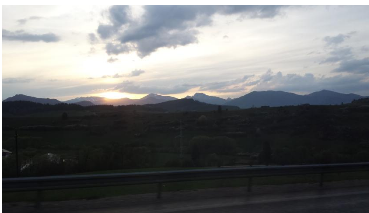
Slika 2: Sončni zahod na Češkem