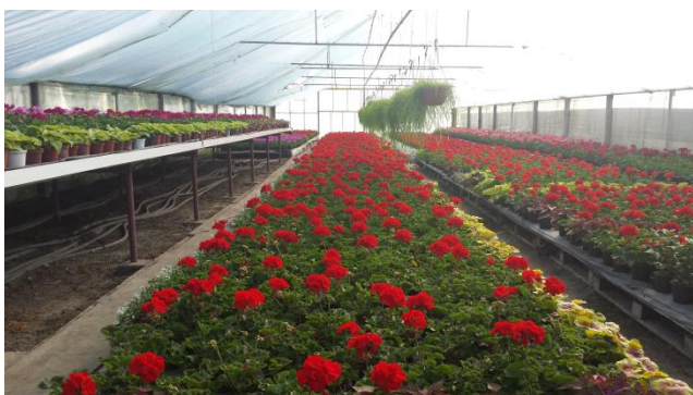
Slika 55: Rastlinjak z rožami

Zajtrk nas je pričakal ob 6:40, iz hotela pa smo se štirideset minut kasneje. Ogledali smo si rastlinjake z rožami. Tam gojijo tudi bio zelenjavo, ki jo prodaja lokalno. Imajo nekaj ptic in psov. V lasti imajo 35 he posestva. V času našega obiska ni bilo ugodno vreme za rože, zato bodo morali s prodajo še malo počakati. Okolica je bila zelo lepo urejena. Ustavili smo se tudi na konjski farmi. Razkazali so nam kmetijo in peljali smo se s kočijo. Pogreli smo se ob ognju. Odpeljali smo se do živalskega vrta. Najprej smo si ogledali terari in akvarij, kj je bil v stavbi. Najbolj všeč so mi bile ribe, najmanj pa ščurki. Zunaj smo videli ptice in sesalce. Zebra je bila zelo dobrovoljna, ob ograji je tekala z nami sem ter tja. Odpeljali smo se na Bowling, razdelili smo se v skupine in se pomirili. Bilo je zelo zabavno. Za kosilo so nam naročili pice. Na poti nazaj smo se ustavili v nakupovalnem centru. Imel smo dve uri časa, za nas je bila to dobra priložnost, saj so cene za odtenek nižje kot pri nas. Po prihodu v hotel nas je čakala še večerja. Utrujeni in zadovoljni od celega dneva smo se odpravili spat.