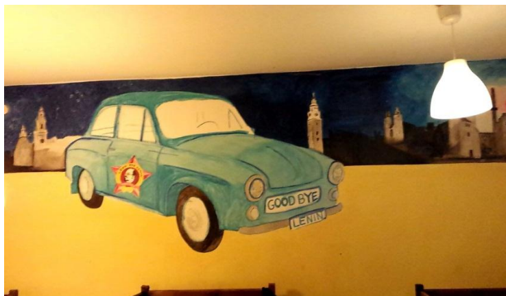
Slika 1: Poslikava po steni hostla Good bye Lenin