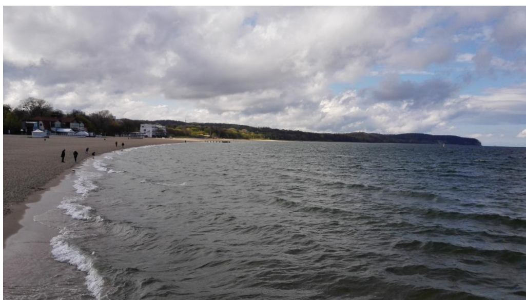
Slika 43: Pogled na Baltsko morje