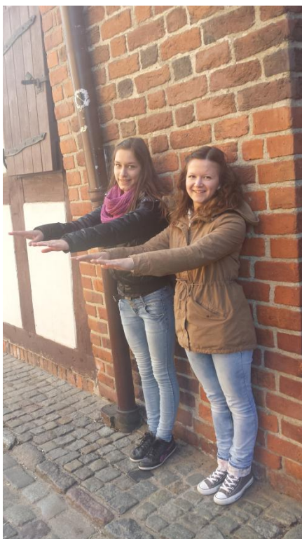
Slika 51: Poševni stolp