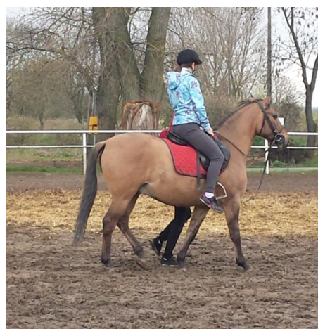
Slika 44: Jahanje konj