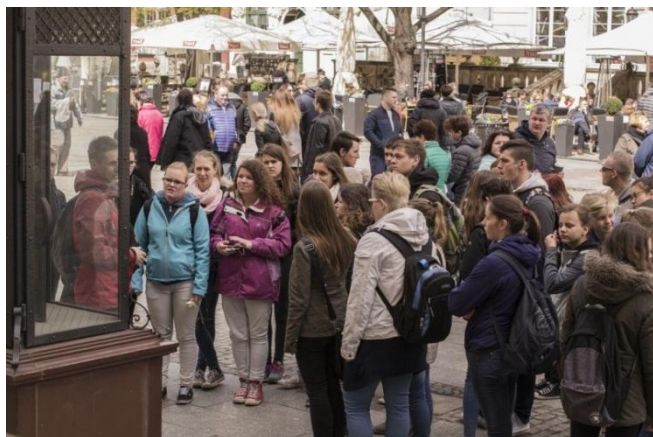
Slika 37: Fahrenheitova temperaturna lestvica