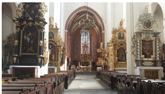
Slika 49: Najstarejša cerkev v Torunu