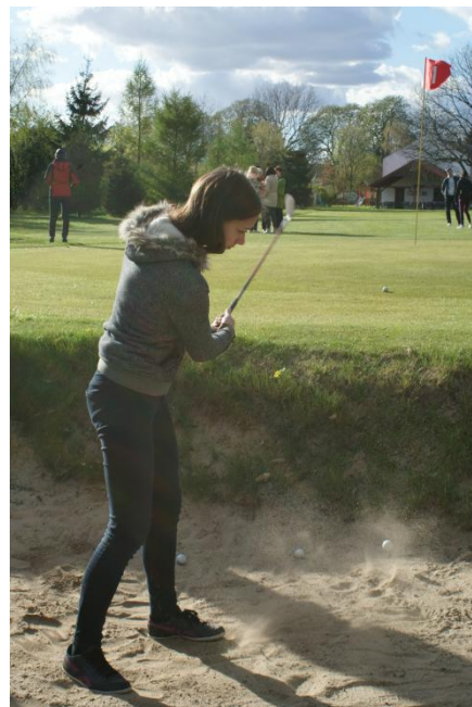
Slika 31: Igranje golfa v pesku