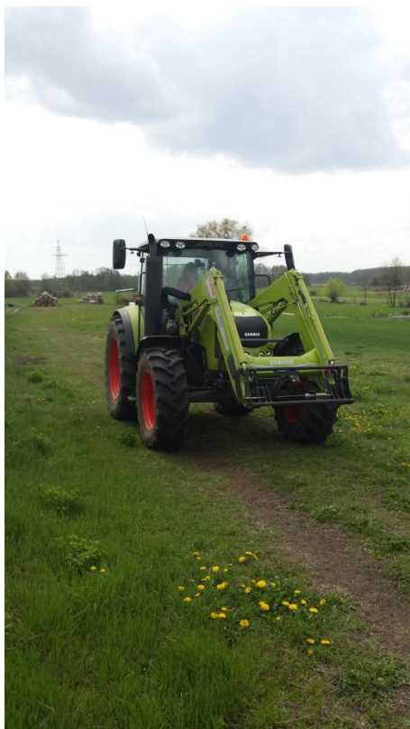
Slika 35: Vožnja s traktorjem pri gostiteljski družini