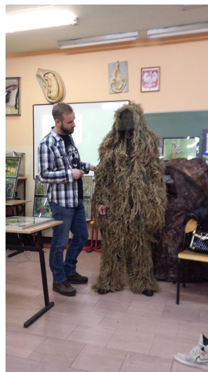
Slika 19: Oprema za slikanje divjih živali