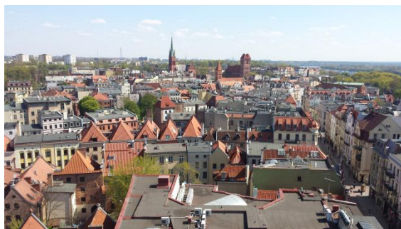
Slika 50: Razgled s stopla