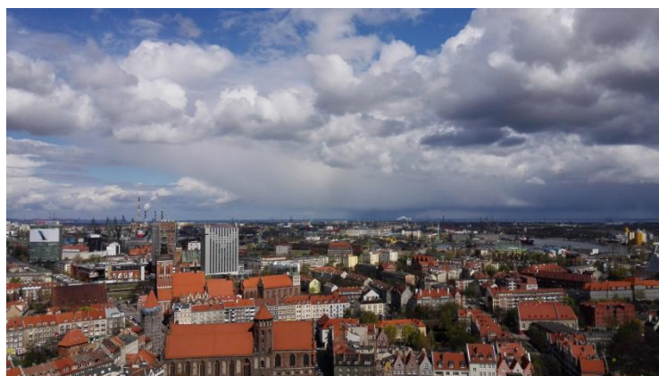
Slika 40: Razgled s stolpa