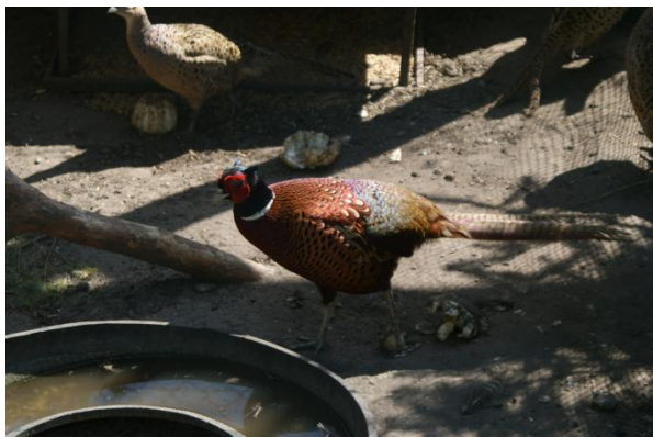
Slika 26: Živali na šoljskem vrtu