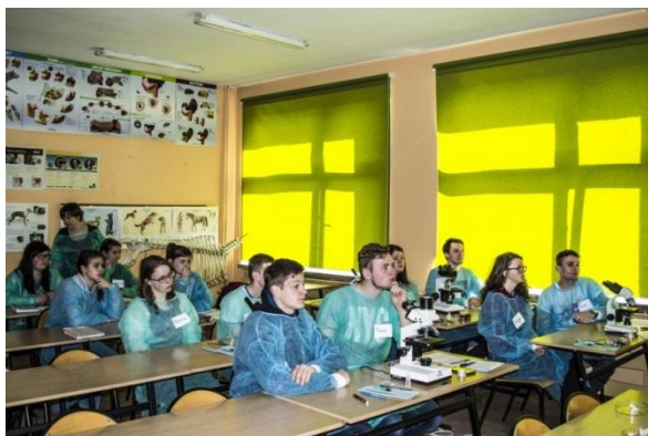
Slika 27: Mikroskopiranje gliv

Zajtrk smo imeli ob pol osmih. Nato smo se odpravili v šolo, tokrat na bolj praktična izobraževanja. Slovenski dijaki smo se razdelili na tri skupine, ter se pomešali s poljaki. Prvo uro smo mikroskopirali. Raziskovali smo mikofikozes in kandido ter njuni posledici na živalih. Drugo uro smo sadili rože, urejali smo šolski vrt. Podarili so nam rože pod imenom lilijevec. Tretjo uro smo preučevali peresa, ptiče, gnezda. Jajca smo položili v inkubator. V temni sobi smo pod lučjo opazovali zarodke v jajcu. Na tak način ugotovijo ali je jajce oplojeno ali ni. Razkazali so nam cvetličarsko delavnico. Naredili smo si venčke iz cvetja. Za darilo so nam podarili dekorativno rožico. Zadnja delavnica, ki so nam jo pripravili je bila nekaj sto metrov izven šole. Skupaj z dijaki smo vozili traktorje. Nato so nam ponudili klobasice, a smo jih morali zavrniti, ker nas je v hotelu že čakalo kosilo. Odpeljalismo se na zelenico igrati golf. Gospod nam je razložil kako drži palico in kako moramo udariti žogico. Sprva smo imel nekaj težav, a smo se kmalu naučili. Poskusili smo žigico poslati čim dlje, pri tem smo imeli kar veliko težav, ker nismo zadeli žogice. Veliko smo se nasmejali. Poskušali smo žogice spraviti iz peska ter čez vodo, to pa je bilo še težje. V poslopju zraven igrišča so nam pripravili pogostitev. Klobasice so nam po igranju golfa dobro dele. Pocrkljali so nas tudi s pecivom, čajem in kavo. Po končanem druženju smo se odpravili nazaj v hotel.