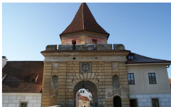
Slika 65: Most, ki vodi v mesto