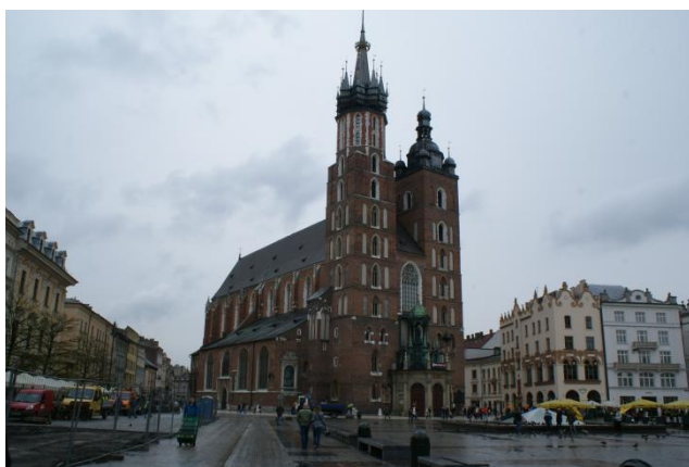
Slika 4: Bazilika Saint Mary