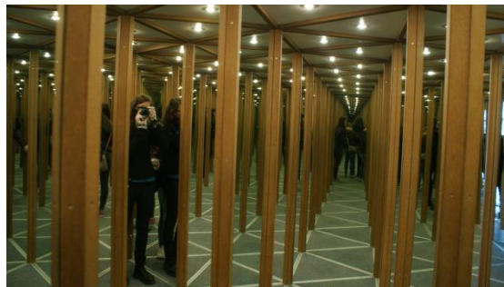
Slika 61: Labirint