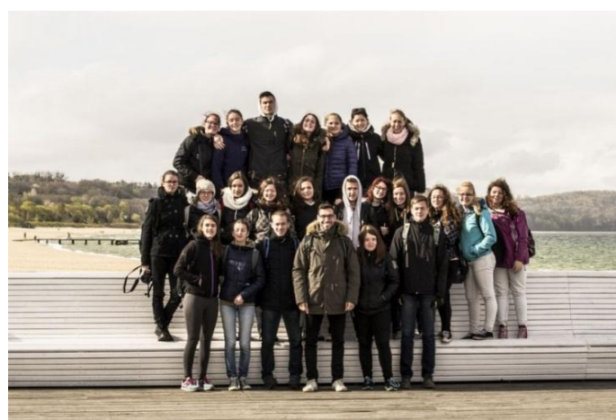
Slika 42: Skupinska slika