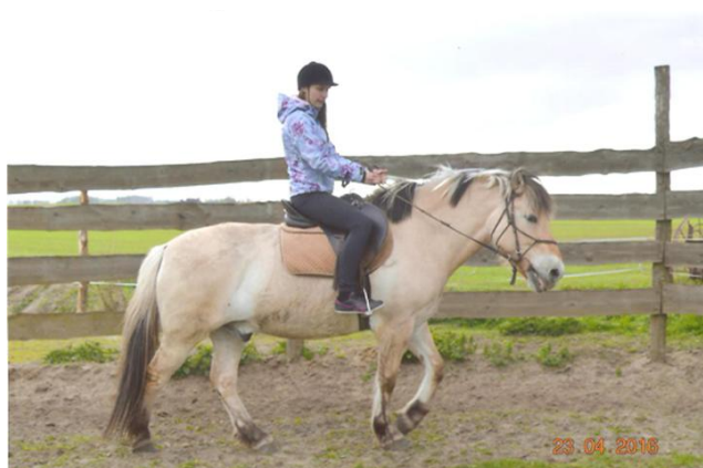
Slika 34: Jahanje konja