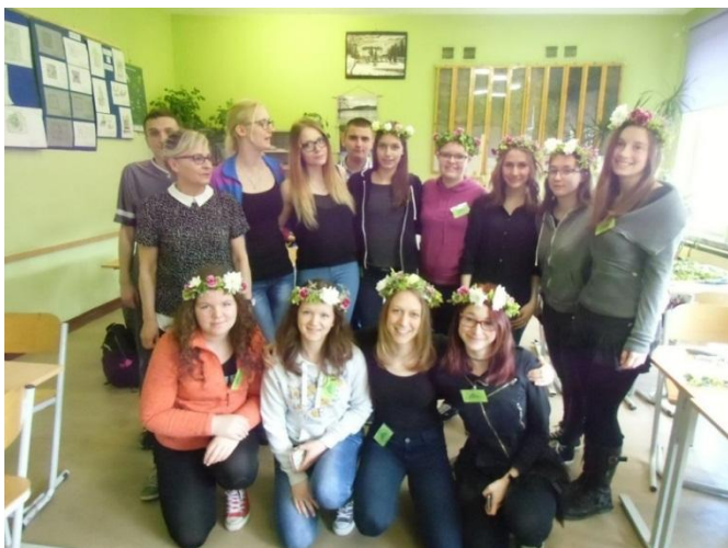
Slika 33: Izdelava venčkov