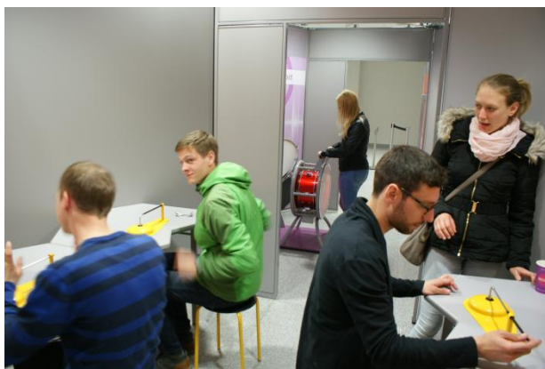
Slika 54: Hiša eksperimentov