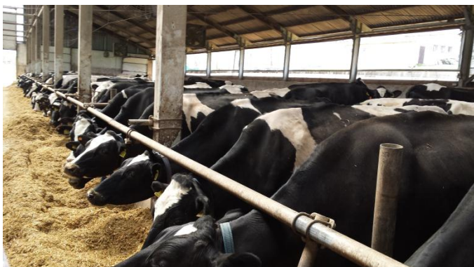
Slika 46: Kravja farma