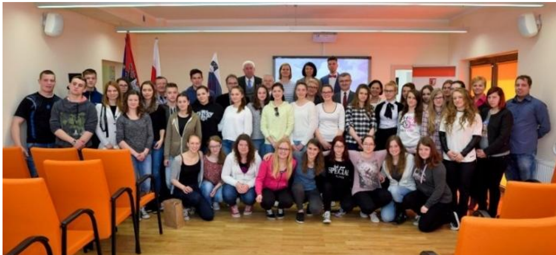
Slika 18: Skupinska slika na našem sprejemu