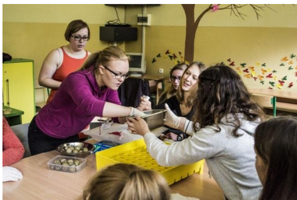
Slika 29: Priprava jajc za inkubator