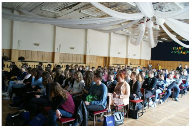
Slika 59: Poslovilna prireditev