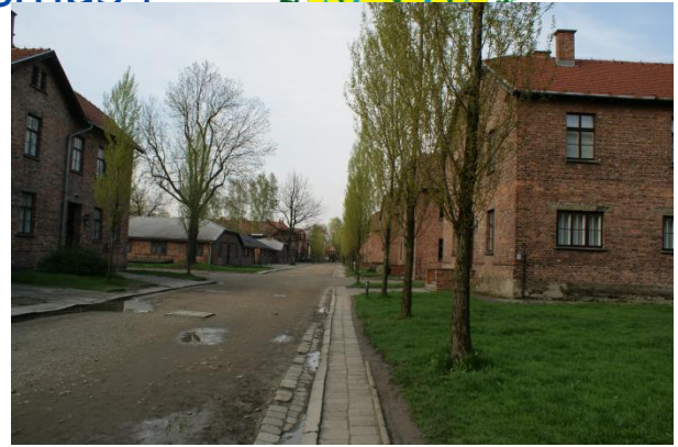
Slika 13: Stavbe v Auschwitz I