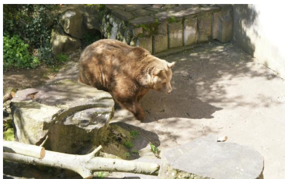
Slika 63: Medved pred gradom