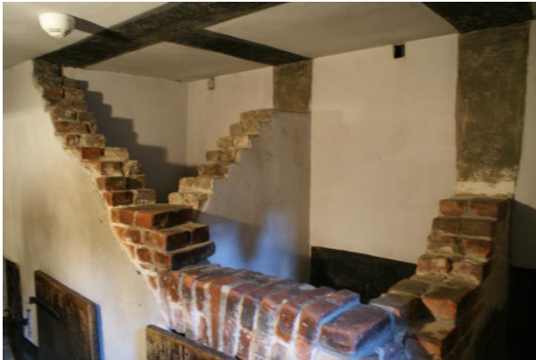
Slika 12: Kletke za zaornike